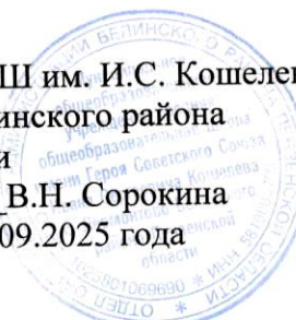
График посещения пищеблока членами комиссии по родительскому контролю за организацией питания обучающихся на 2025-2026 учебный год.